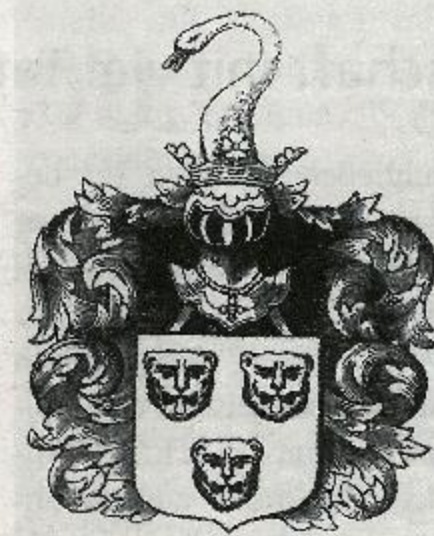
Das Bocholtzwappen mit Helmzier.