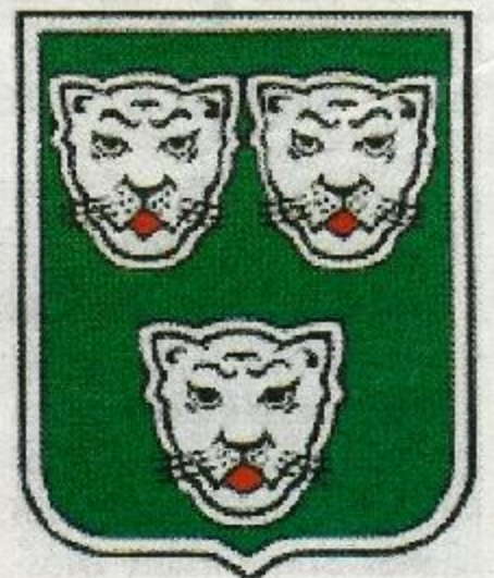
Das Wappen des Adelsgeschlechts der von Bocholtz.

Über diejenigen Orte, die heute touristisch interessant sind und als Ausflugsziel per Fahrrad oder PKW erreicht werden können, berichtet Greta van der Beek-Optendrenk in einer kleinen Reihe für die Grenzland-Nachrichten. In den nächsten Ausgaben