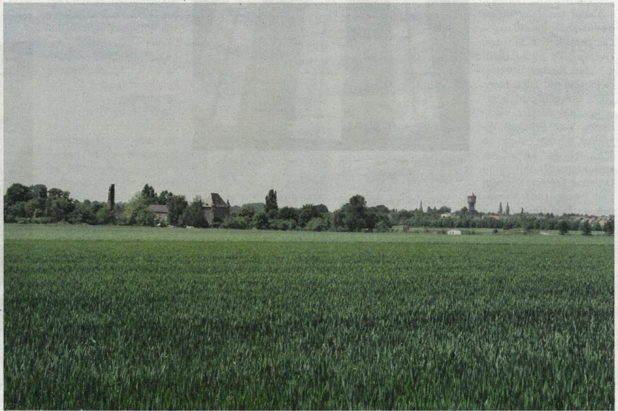
Lobberich - links mit der Burg Bocholtz, rechts ist der Wasserturm zu sehen.